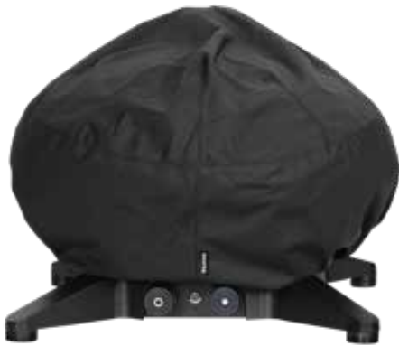
NEUHEIT Morsø Forno Gas Medio Cover