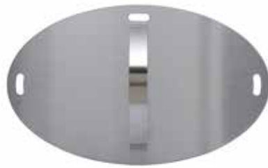
Morsø Tür für Grill Forno