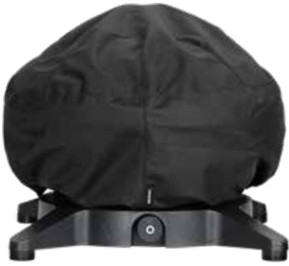
NEUHEIT Morsø Forno Gas Piccolo Cover