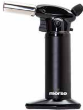
Morsø Gas Lighter