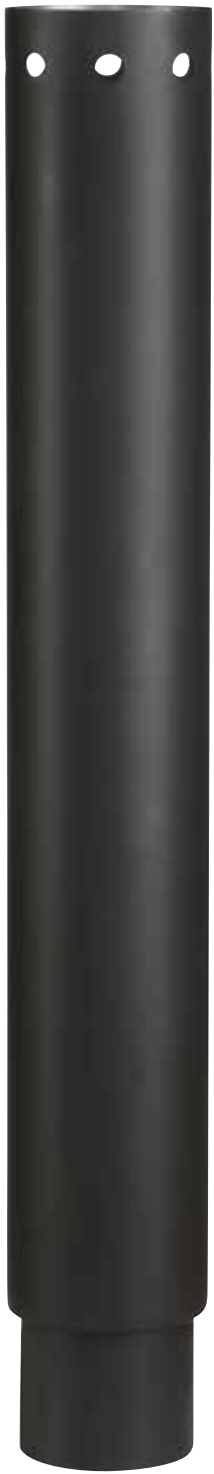
Morsø Schornsteinrohr für Forno H75 x ø 12,4 cm