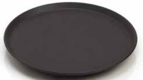
Morsø Bratteller Ø 32 cm