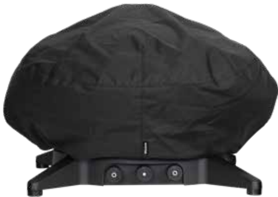
NEUHEIT Morsø Forno Gas Grande Cover