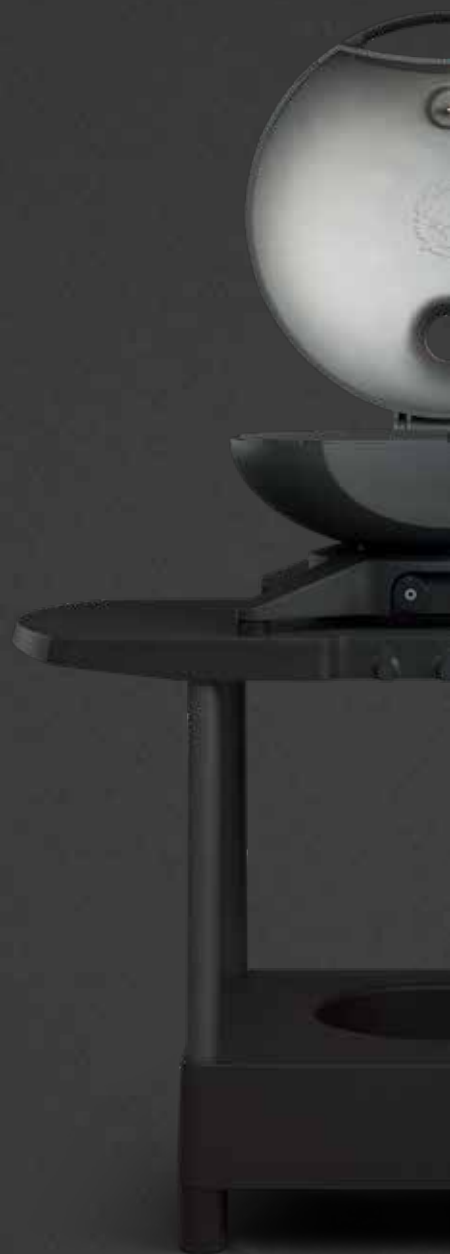
Morsø Forno Gas Medio Morsø Tavolo NEUHEIT Entworfen von Klaus Rath