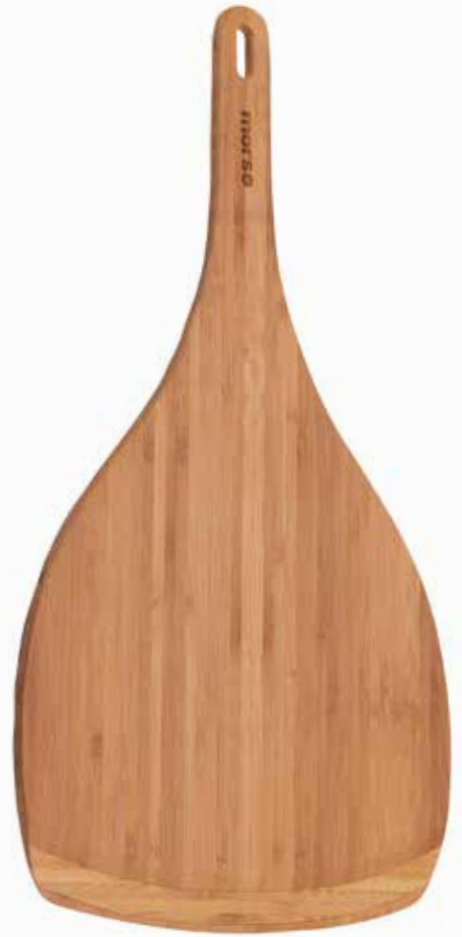
Morsø Pizzaschaufel aus Bambus