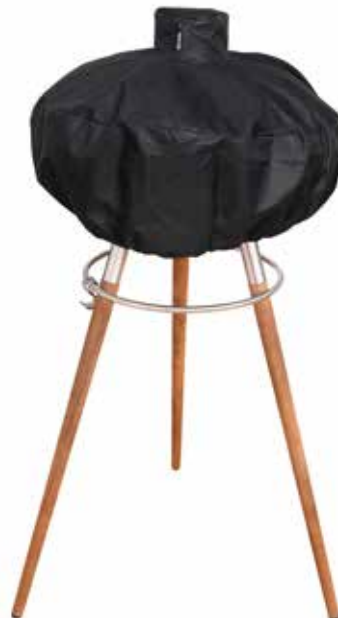
Morsø Grill Forno Cover