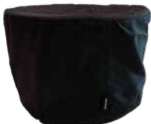
Morsø Jiko Cover