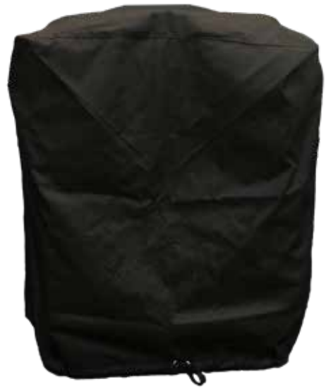
Morsø Grill '17 Cover