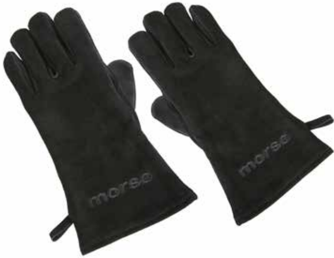
Morsø Handschuh für rechte und linke Hand