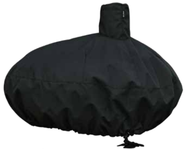
Morsø Forno Cover