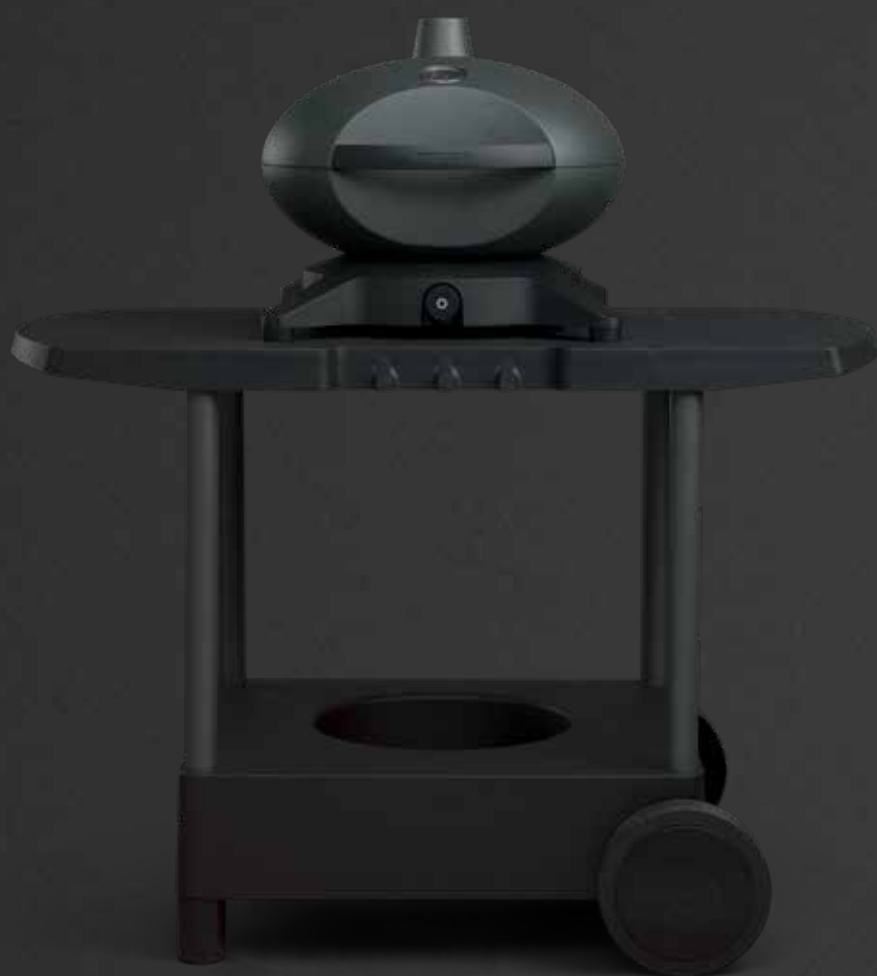
Morsø Forno Gas Piccolo NEUHEIT Morsø Tavolo NEUHEIT Entworfen von Klaus Rath für Morsø