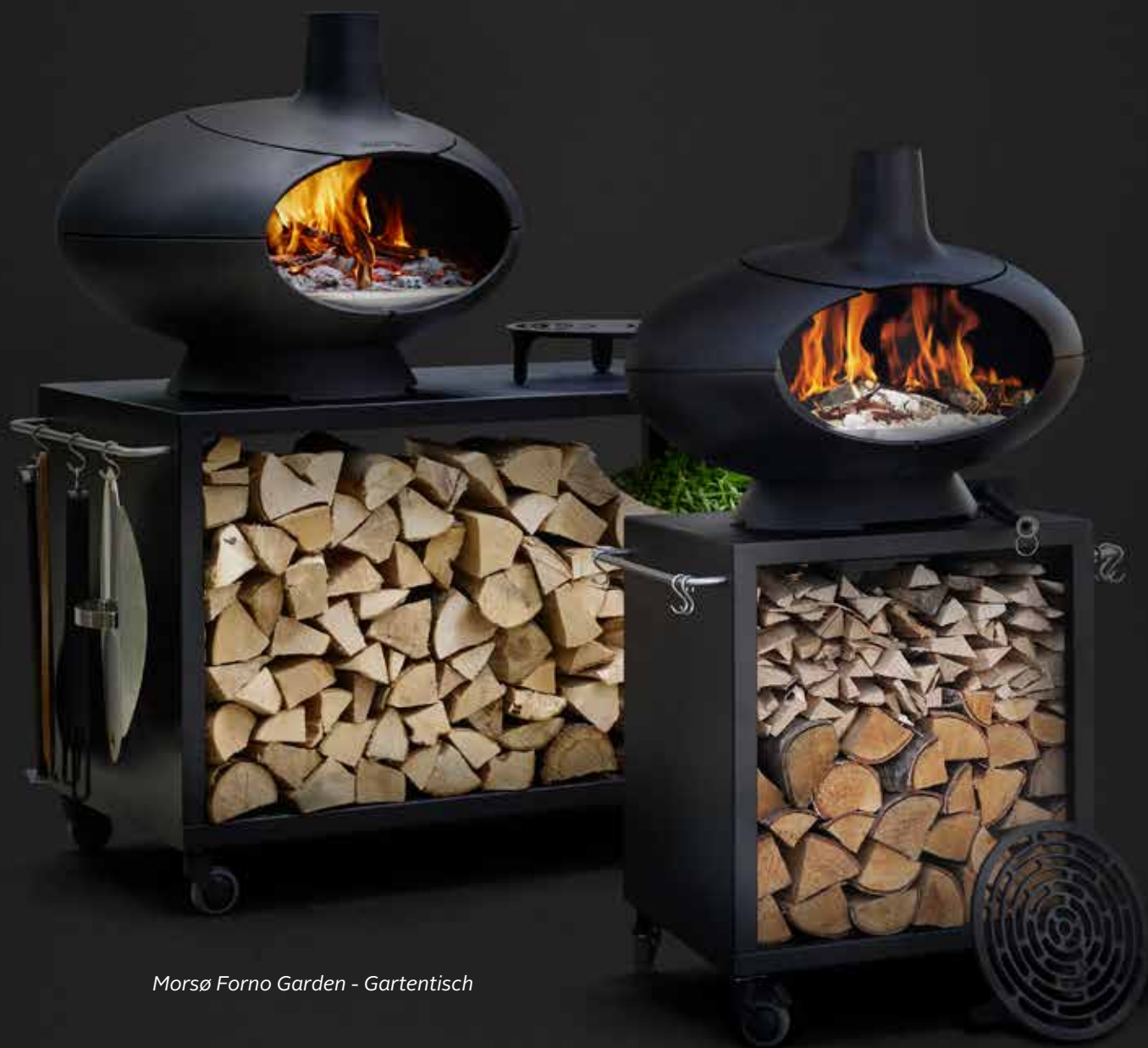
Morsø Forno Garden - Gartentisch