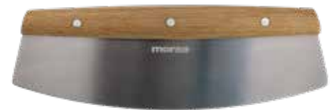
Morsø Pizza- und Kräutermesser