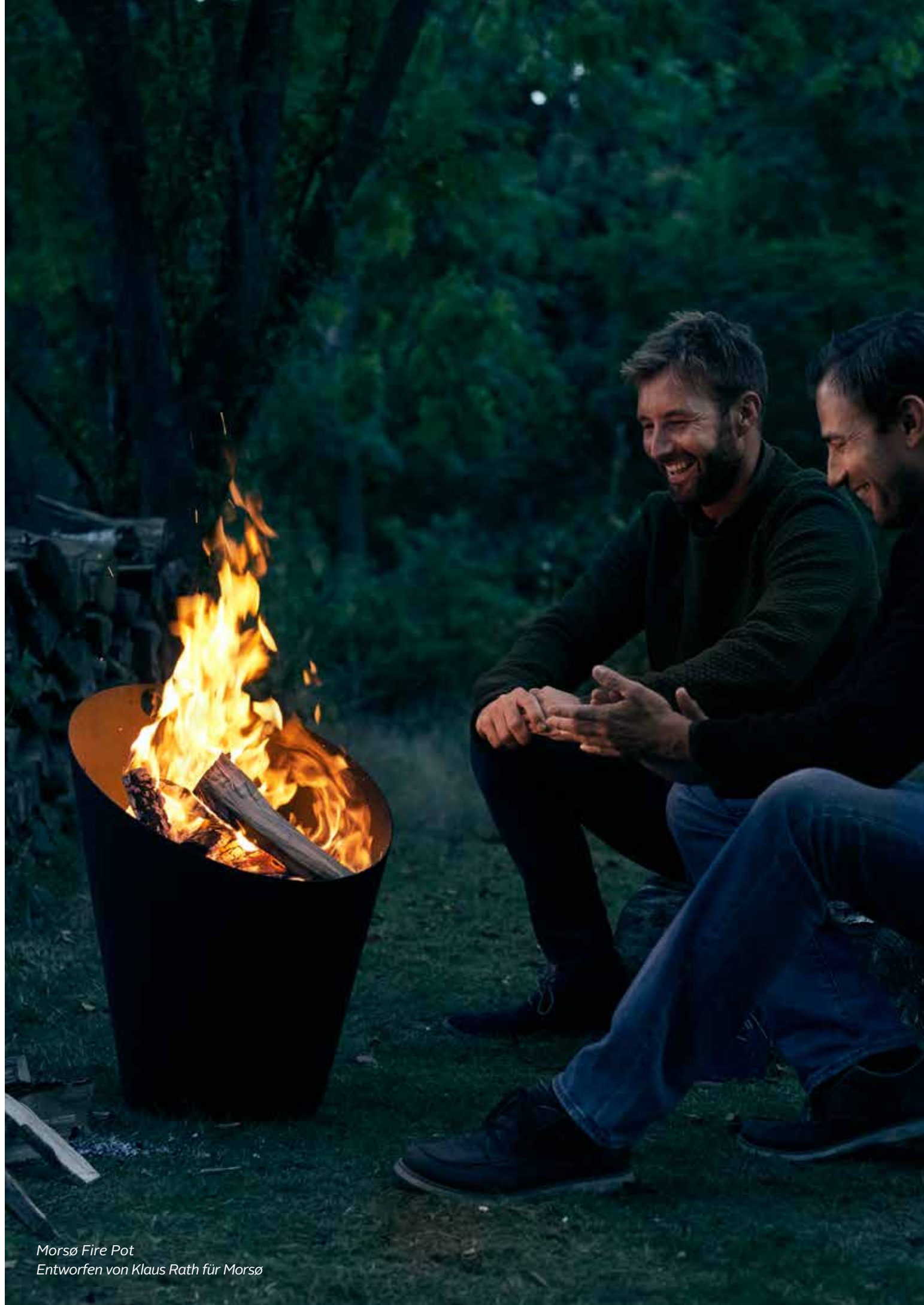
Morsø Fire Pot Entworfen von Klaus Rath für Morsø