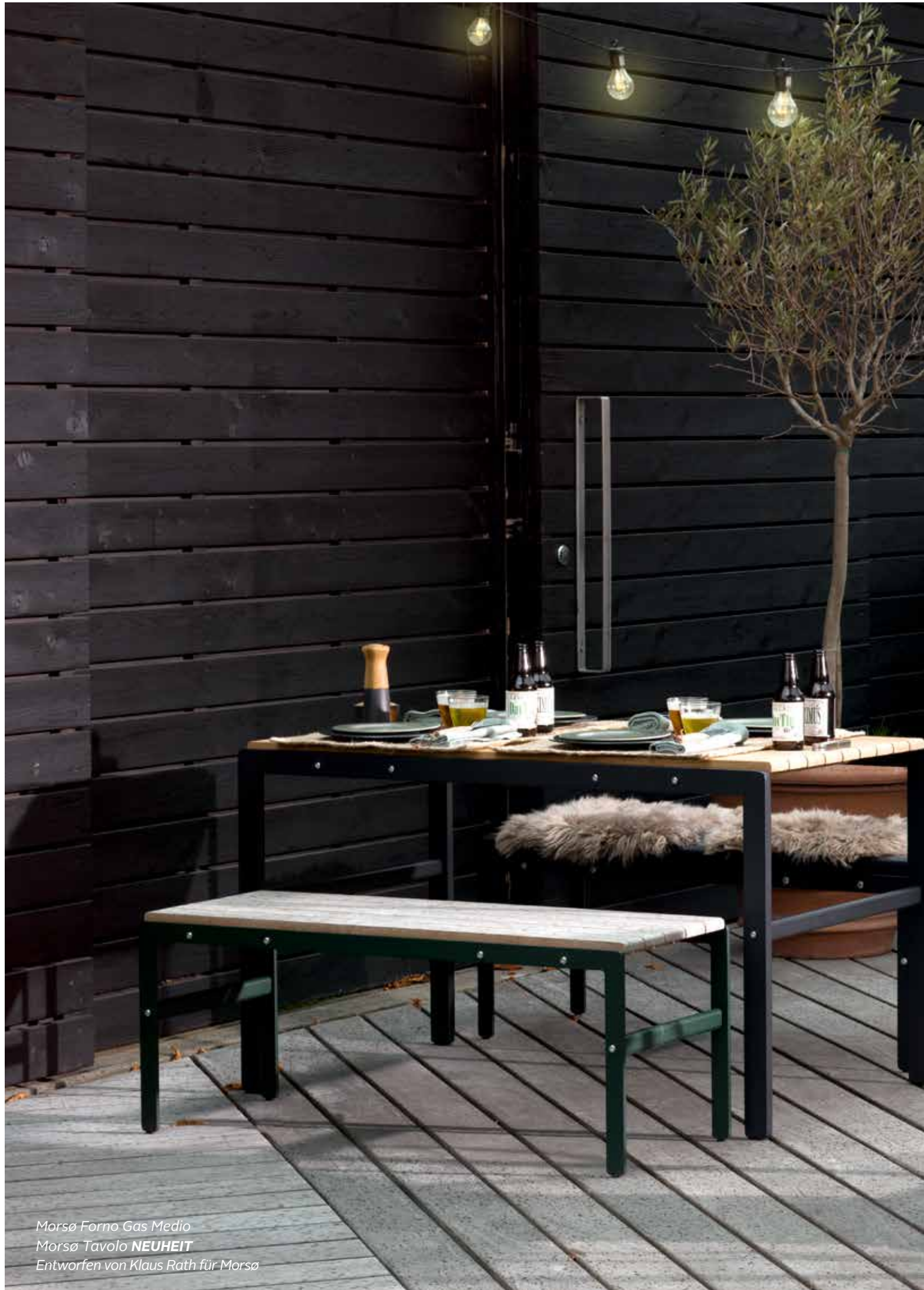
Morsø Forno Gas Medio Morsø Tavolo NEUHEIT Entworfen von Klaus Rath für Morsø