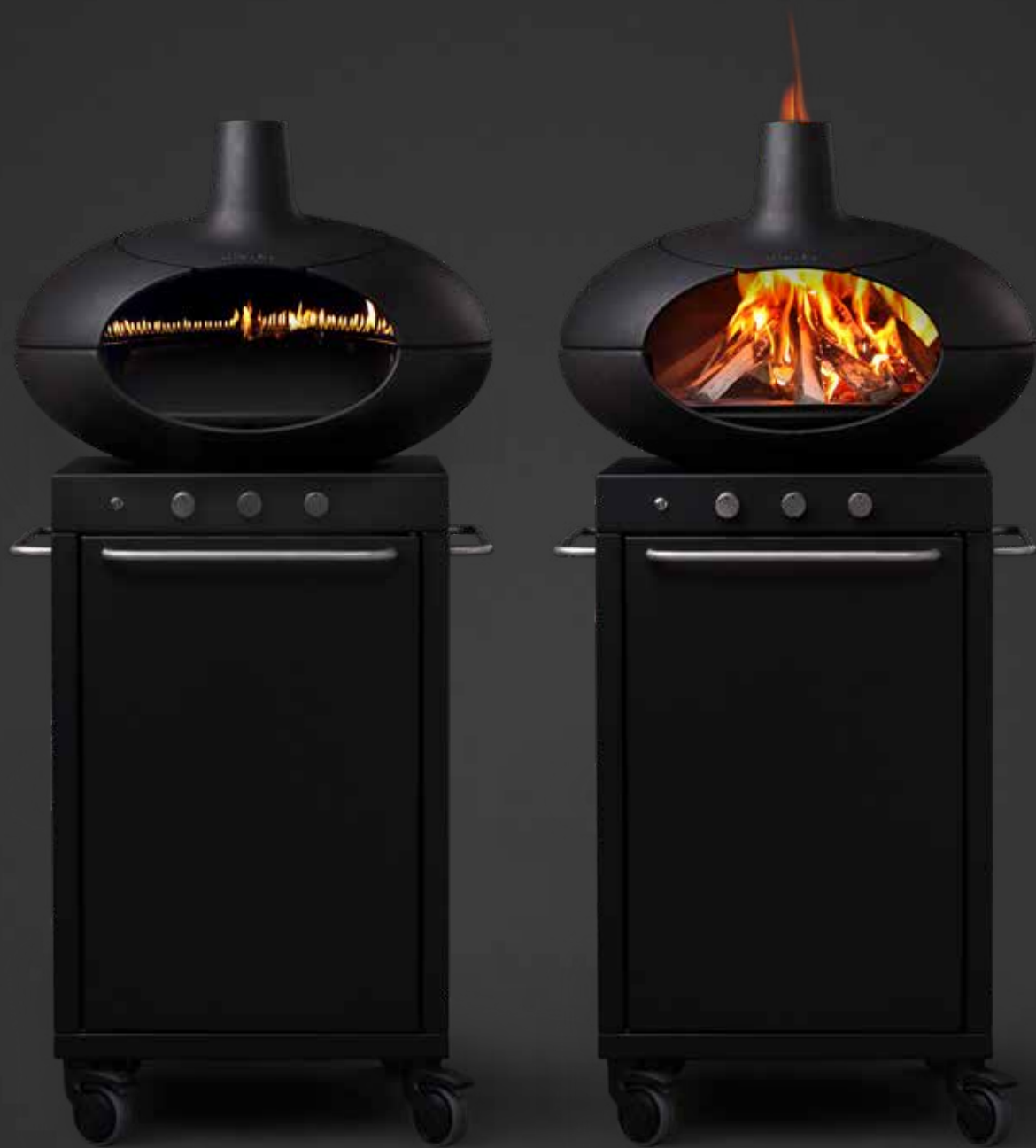
Morsø Forno Multi Entworfen von Klaus Rath für Morsø - Grill zur Gas und Holz