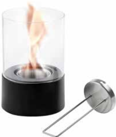
Morsø BEL Lampe