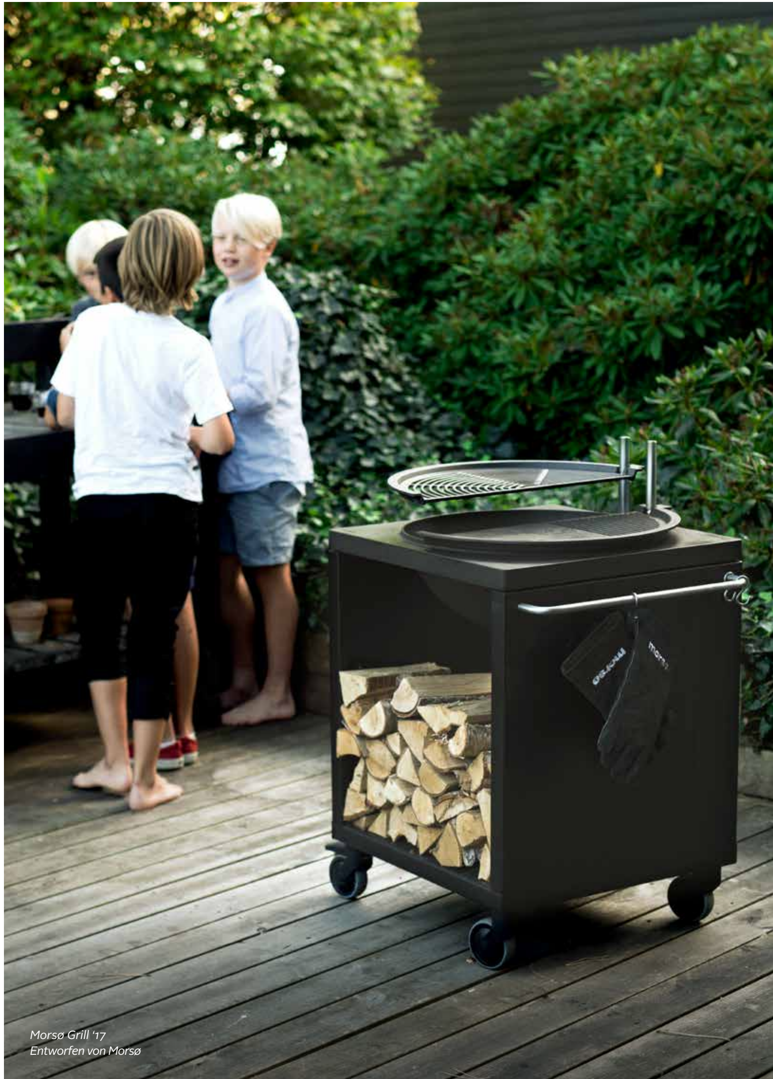
Morsø Grill '17 Entworfen von Morsø