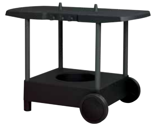
NEUHEIT MORSØ TAVOLO - Tisch nur für Forno Gas