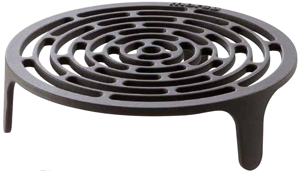
Morsø Tuscan Grilleinsatz ø 34 cm