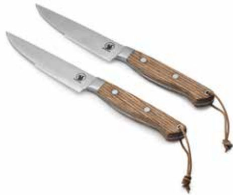
Morsø CULINA Steacknive - 2 stk.