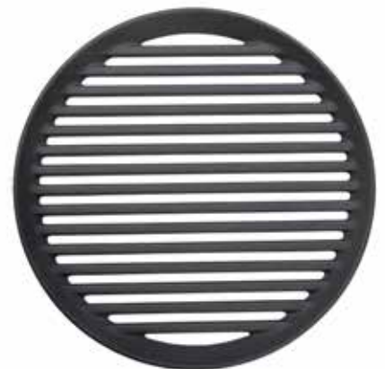
Morsø Grillrost aus Gusseisen für Grill Forno