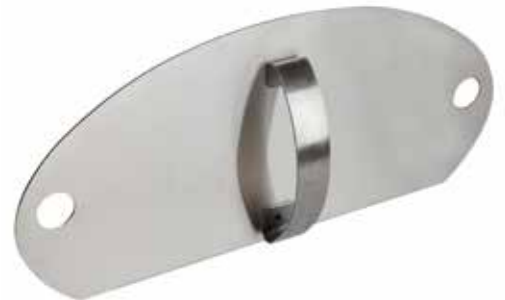
Morsø Tür für Forno