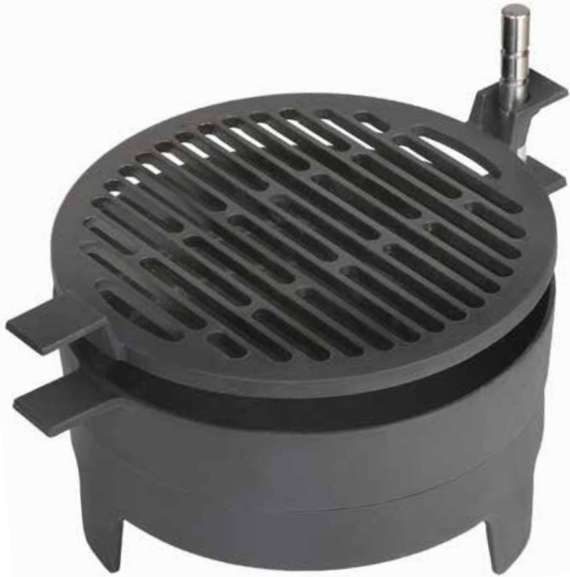
Morsø Grill '71 Table