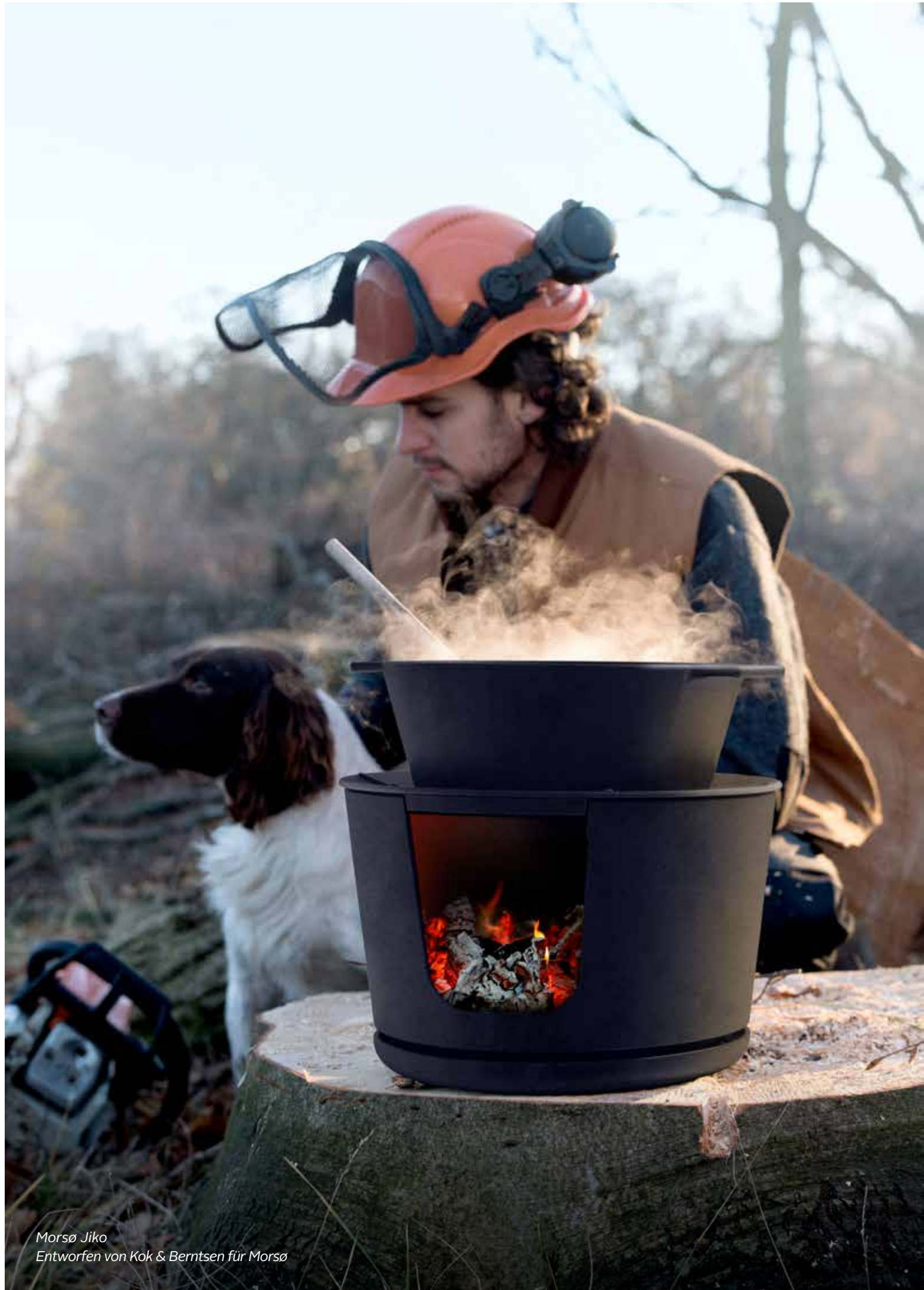
Morsø Jiko Entworfen von Kok & Berntsen für Morsø