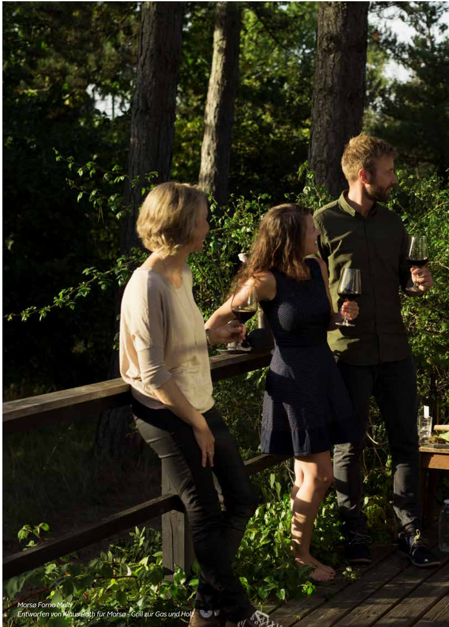
Morsø Forno Multi Entworfen von Klaus Rath für Morsø - Grill zur Gas und Holz