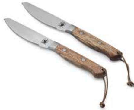
Morsø CULINA Pizzaknive - 2 stk.