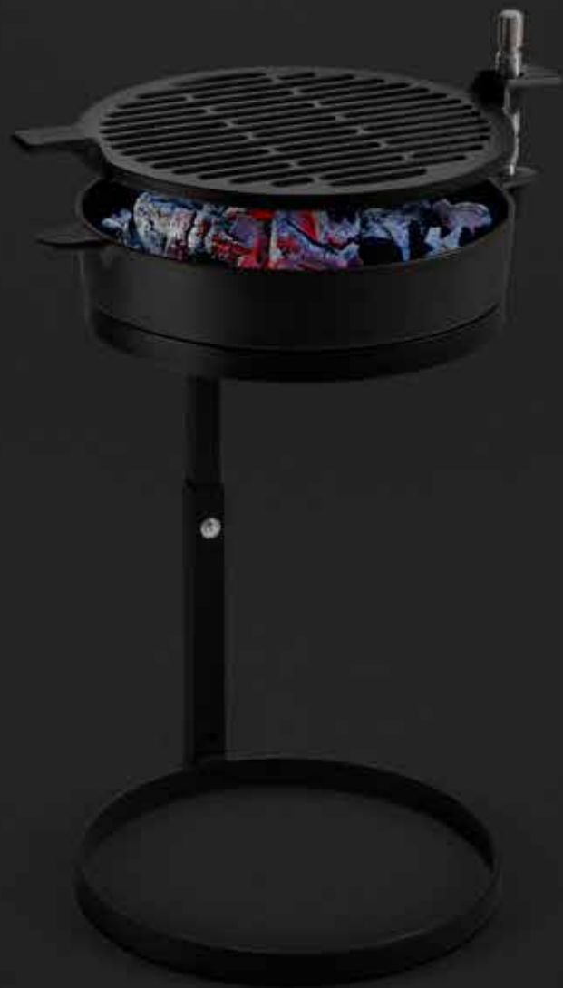
Morsø Grill '71 Entworfen von Morsø