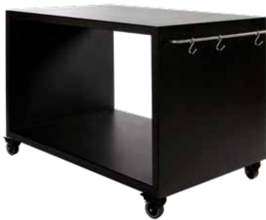
Morsø Forno Garden - Gartentisch