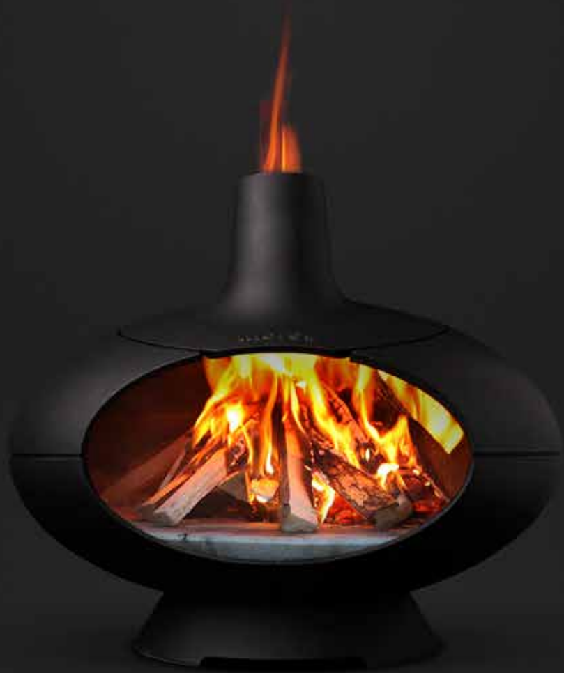
Morsø Forno Entworfen von Klaus Rath für Morsø