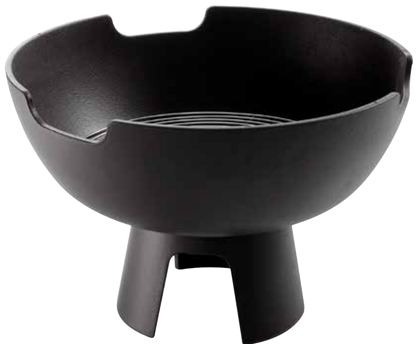
Morsø Ignis Feuerstelle