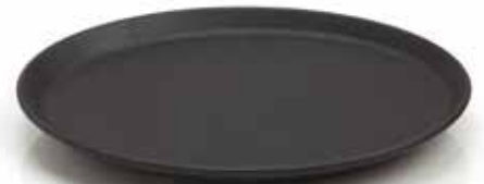
Morsø Grillteller (2er-Set) 20 x 30 cm