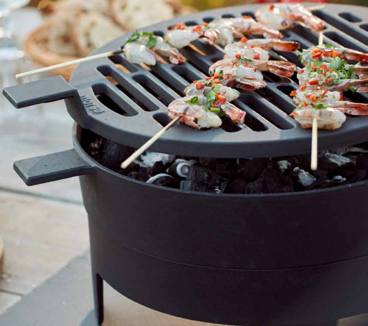
Morsø Grill '71 Table Entworfen von Morsø