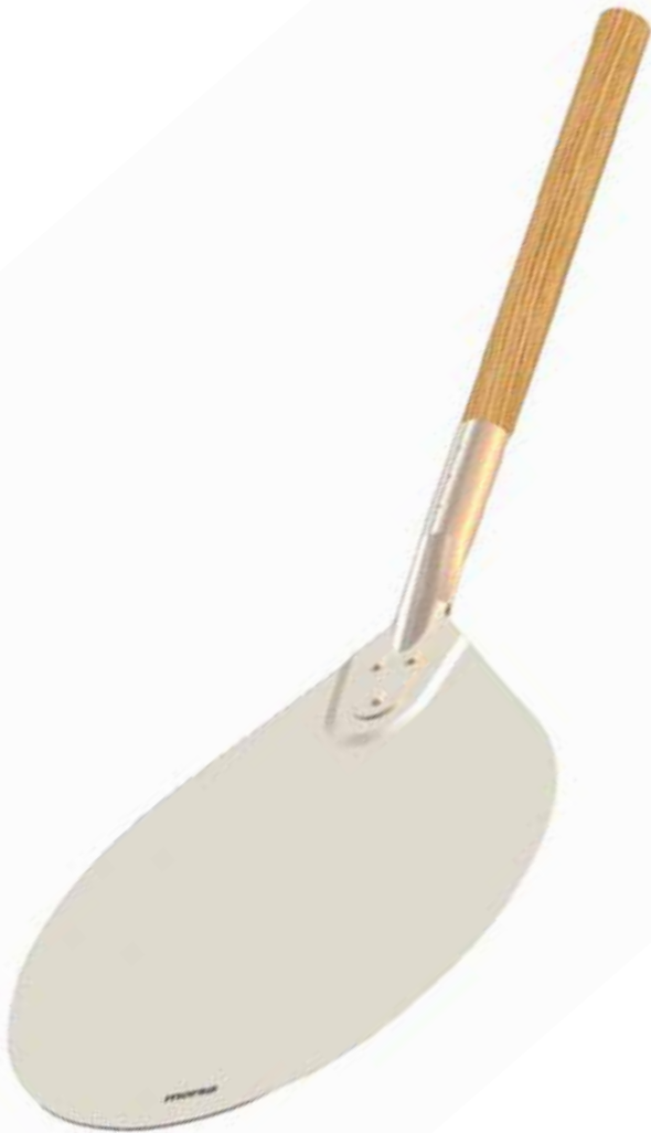
Morsø Pizzaschaufel aus Alu