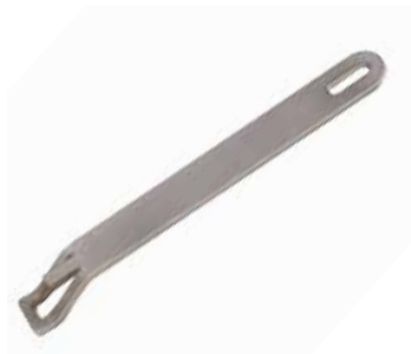
Morsø Griff für Grillrost und -teller