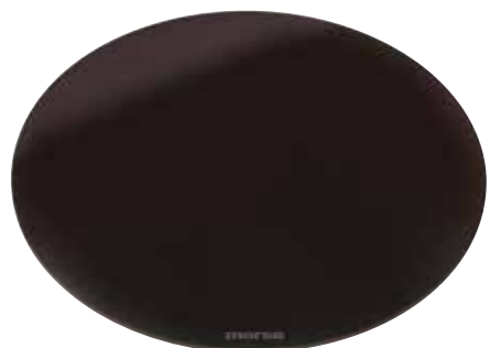
Morsø Vetro Pizza- und Bratplatte