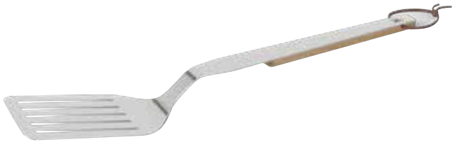
Morsø CULINA BBQ Grillschaufel