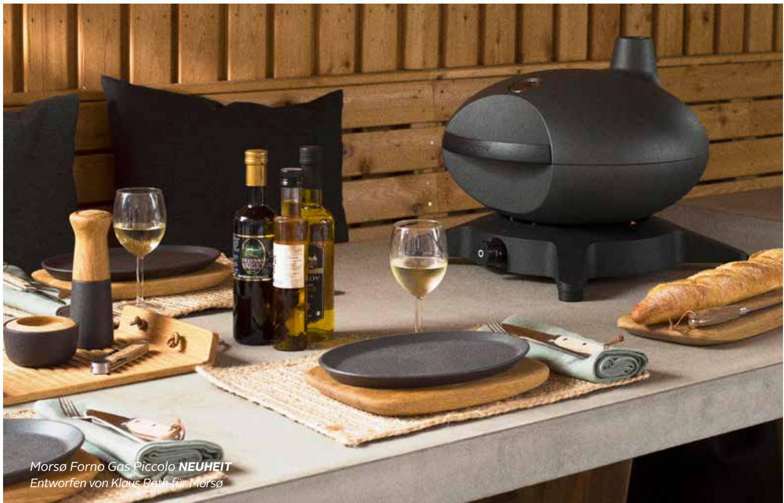
Morsø Forno Gas Piccolo NEUHEIT Entworfen von Klaus Rath für Morsø