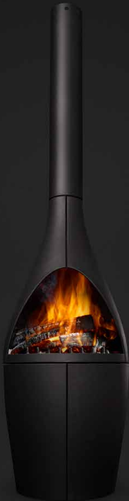
Morsø Kamino Entworfen von Klaus Rath für Morsø