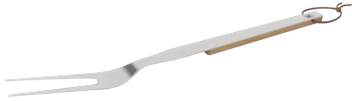
Morsø CULINA BBQ Grillgabel