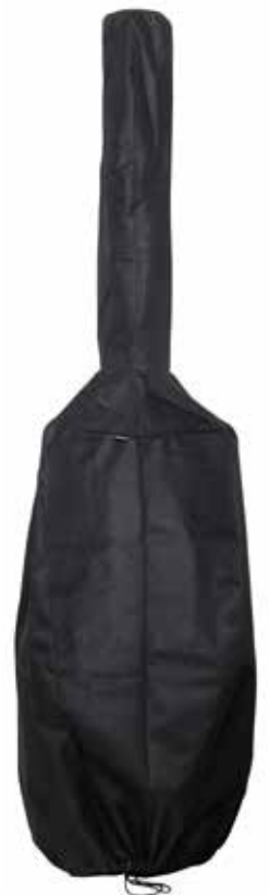
Morsø Kamino Cover