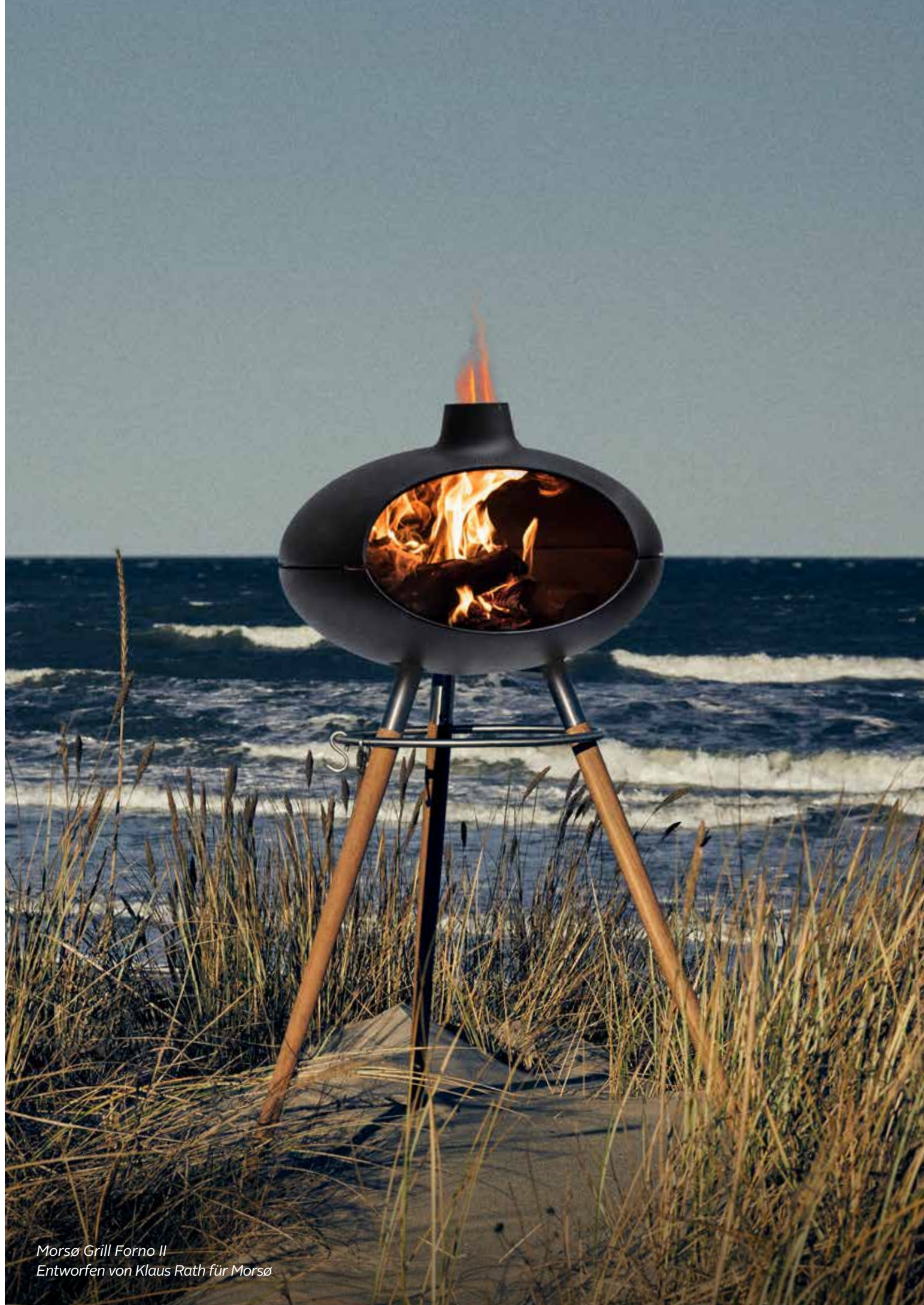
Morsø Grill Forno II Entworfen von Klaus Rath für Morsø