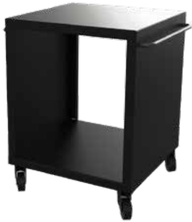
Morsø Forno Terra - Gartentisch